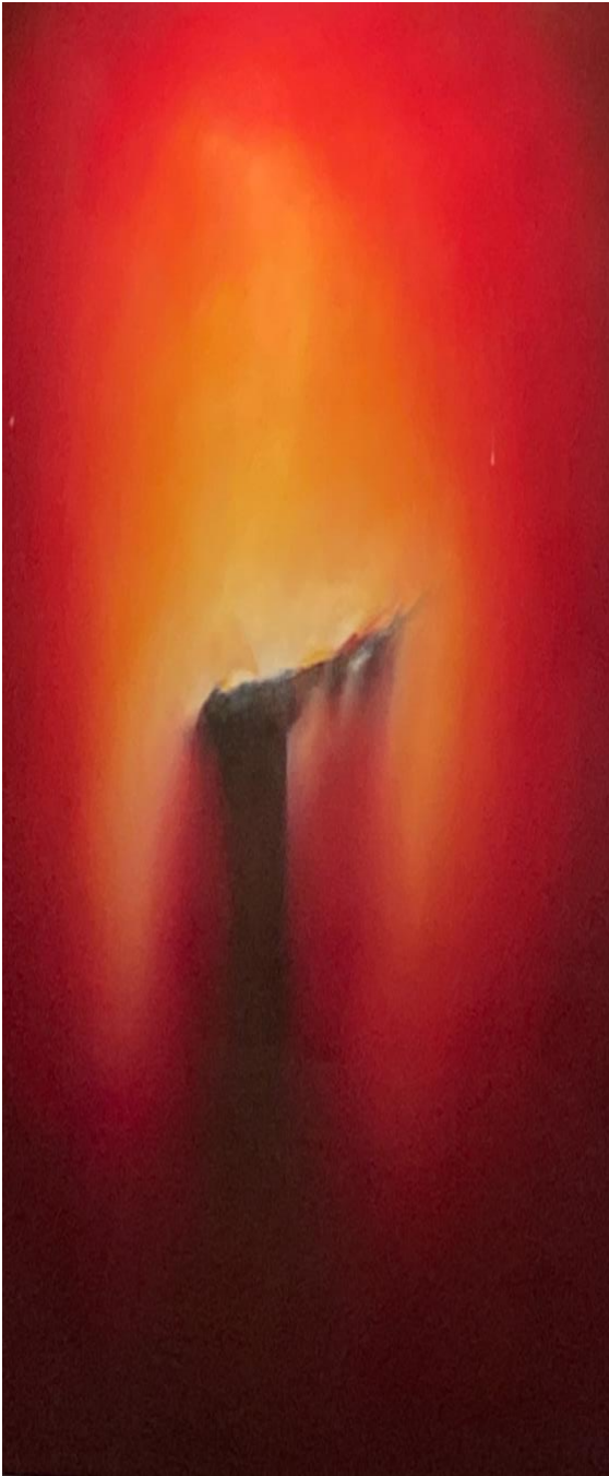
(Altarbild - Autobahnkirche Geiselwind)

Versöhn uns mit der Luft, die wir verpesten. Versöhn uns mit dem Wasser das wir vergiften.