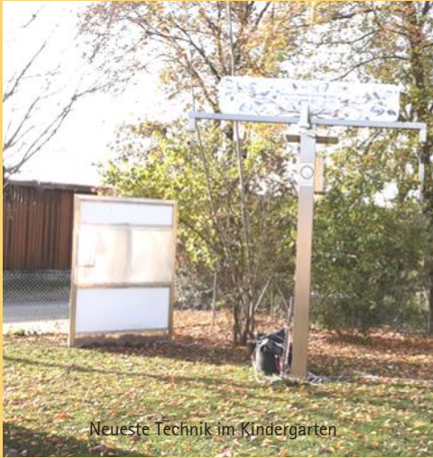
Neueste Technik im Kindergarten

Seit einiger Zeit befindet sich im Kindergarten Zwergenburg Pommersfelden im Garten ein großer Turm mit verschiedenen Kästen und einer Kamera. Aber was ist das nun? Dieser Turm gehört zu einem innovativen Artenschutz-Umweltbildungsprojekt des Vereins Artenschutz in Franken®. Der Kindergarten Zwergenburg hat sich bei dem Projekt Natur meets Technology®, das von der Deutschen Postcode Lotterie unterstützt wird, beworben und ausgewählt. Die Kinder können nun Liveaufnahmen aus einer Nisthilfspezialentwicklung auf einem Monitor, der im Kiga installiert wurde, betrachten. Genauso schaltet die Kamera immer wieder auf die Futtersäulen. Die Kinder sind ganz begeistert, da sie verschiedene Vögel sehen können, die im