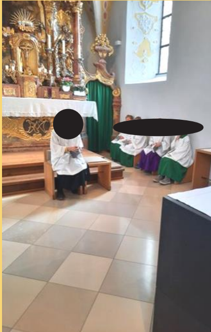
Üben am Altar