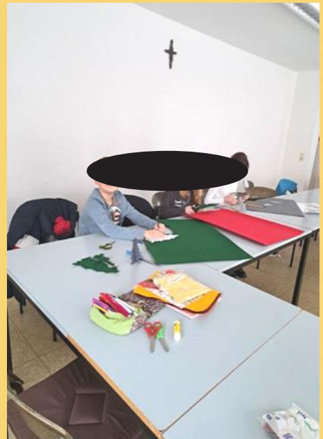
Basteln mit Filz