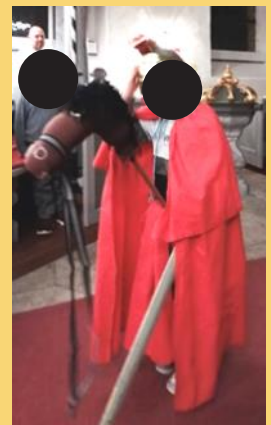
St. Martin in Aktion