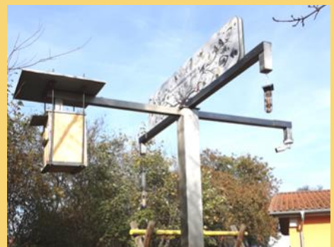
Artenschutz für die Kleinsten

Garten vorkommen. Außerdem sind sie ganz gespannt, wann sich endlich etwas im Nistkasten tut. Nicht nur am Turm sind Futtersäulen angebracht, sondern auch an den vielen Bäumen im Garten. Bei der Futtersuche können alle die verschiedenen Vogelarten beobachtet und bestimmt werden. Die Vogelartenbestimmung wird mit Hilfe der zusätzlich gesponserten Bücher durchgeführt. Aber warum betreibt der Verein so einen Aufwand? Die Artenvielfalt ist nicht mehr allen bekannt und so versucht man bereits die Kleinsten damit vertraut zu machen und sie auch an das Thema Artenschutz heranzuführen. Die Freude, die die Kinder an den neuen Beobachtungen in der Natur haben, zeigen den Erfolg dieses Projekts. Informationen und Bilder vom Bau des Turmes im Kindergarten sind im Internet abrufbar: https://www.artenschutz-steigerwald.de/de/Projekte/1050192/1/