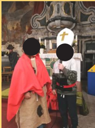
Bischof Martin in der Kirche

Schön ist sie aber doch diese Zeit, in der bei Kerzenschein die wunderbaren Geschichten der Weihnacht einen wesentlichen Bestandteil unseres Kindergartenalltages einnehmen werden.