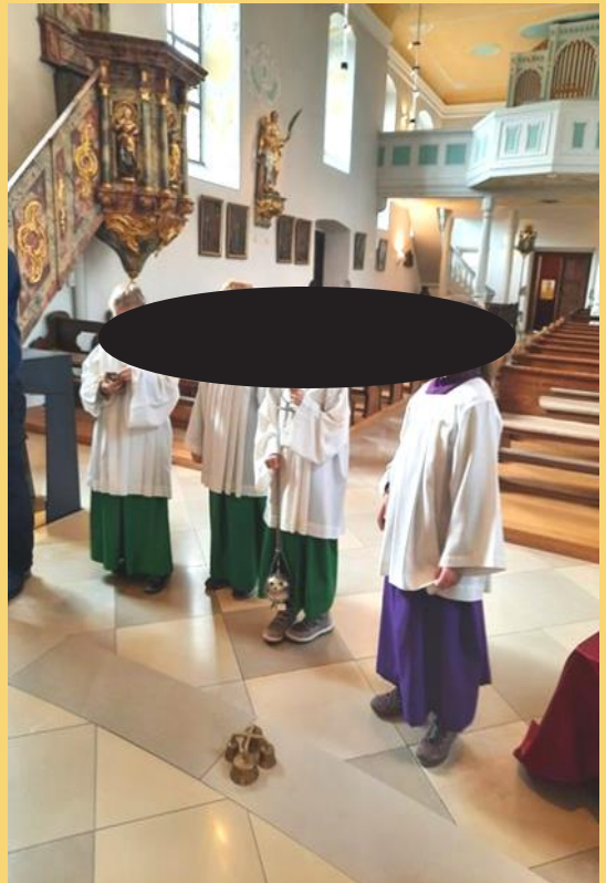
Umgang mit Weihrauch