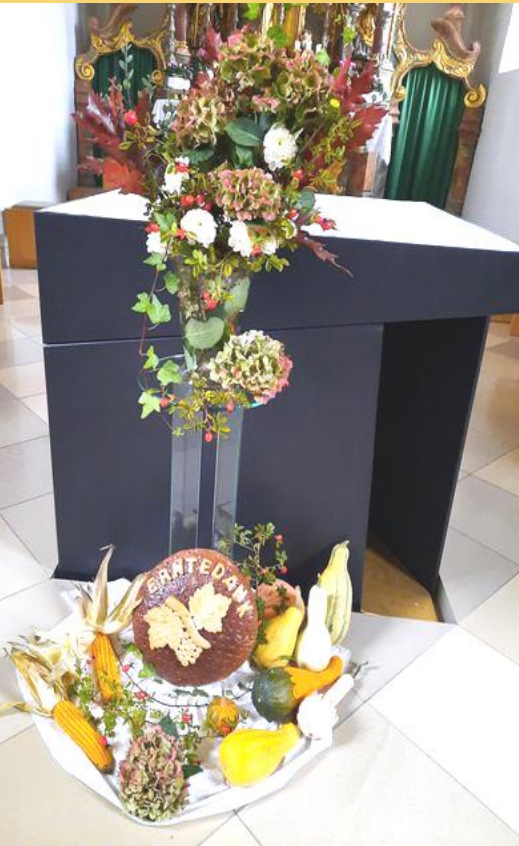
Erntegaben vor dem Altar